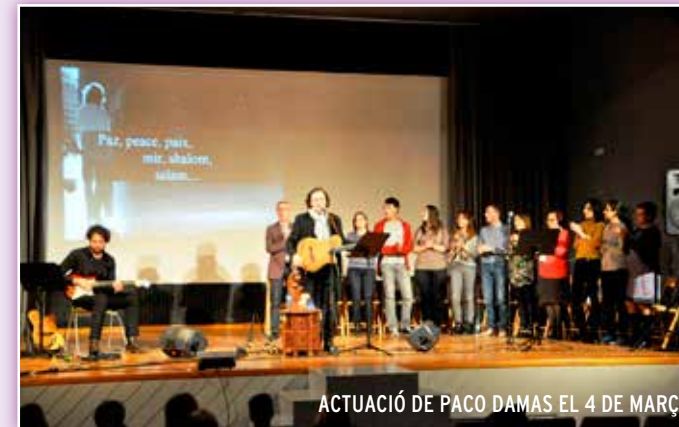
ACTUACIÓ DE PACO DAMAS EL 4 DE MARÇ

Amb la col·laboració de nombrosos col·lectius i institucions, en aquesta ocasió, els actes programats es van concentrar al llarg de la primera setmana del mes, encara que n'hagueren d'altres que van haver de portar-se a terme dies després.