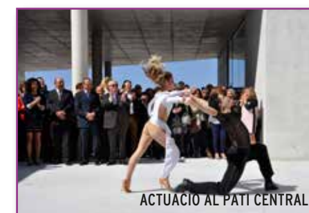
ACTUACIÓ AL PATI CENTRAL