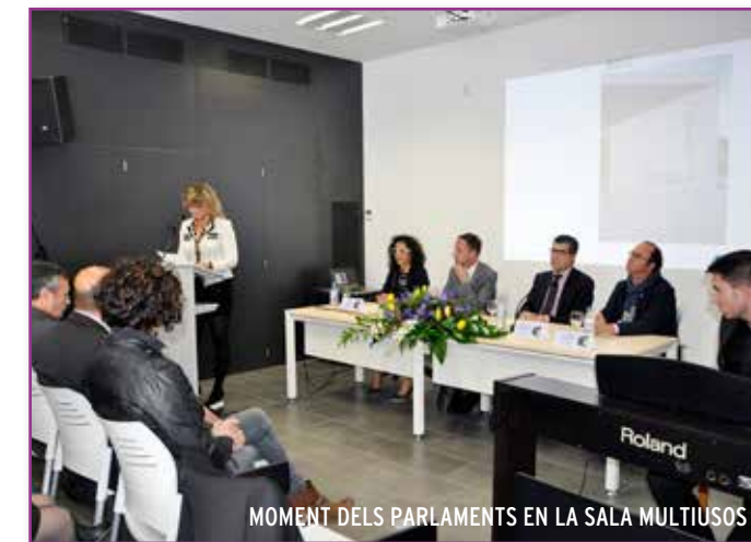
MOMENT DELS PARLaments EN LA SALA MULTIUSOS

L'edifici forma part d'un projecte cultural que inclou la rehabilitació de la Casa de D. Pedro, al costat de l'emblemàtica Torre del Relotge, que ja ha completat la seua primera fase.