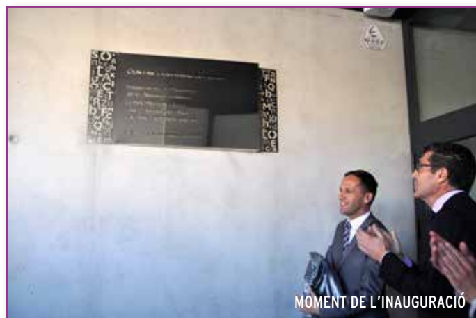
MOMENT DE L'INAUGURACIÓ

El 6 de març va ser un dia molt important per a la història del nostre municipi. La inauguració del nou Centre Cultural "El Pinós" ha marcat un punt d'inflexió i es va desenvolupar d'una manera molt especial, col·laborant amb col·lectius culturals i artístics locals.