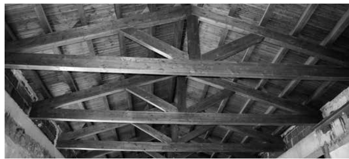
ASPECTE DEL SOSTRE DE FUSTA