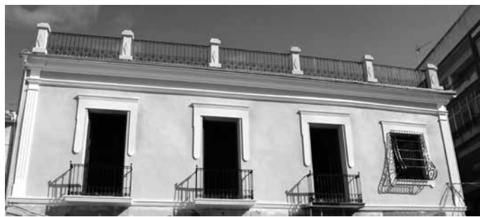
AIXÍ HA QUEDAT LA FAÇANA

Ja ha conclòs la primera fase de la rehabilitació d'aquest cèntric edifici, que va ser residència d'antics alcaldes de la localitat, i que es troba al costat d'un monument emblemàtic per a tots els pinosers, la Torre del Relotge. Durant la Setmana Santa es van desmuntar les bastides, deixant veure l'aspecte renovat de la façana, gràcies