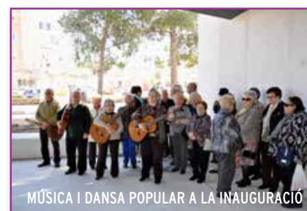
MÚSICA I DANSA POPULAR A LA INAUGURACIÓ

A això cal sumar altres 410,15 m 2 referents a les zones obertes, com porxos d'entrada i patis, més els 2.993 m 2 de la resta de la zona exterior, destacant l'adequació de la zona que limita amb el carrer Pablo Iglesias, on s'han arreglat dues pistes poliesportives.