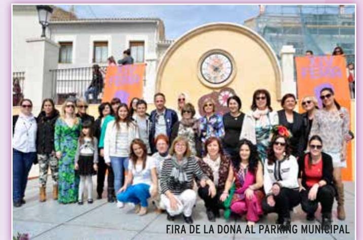
FIRA DE LA DONA AL PÀRQUING MUNICIPAL